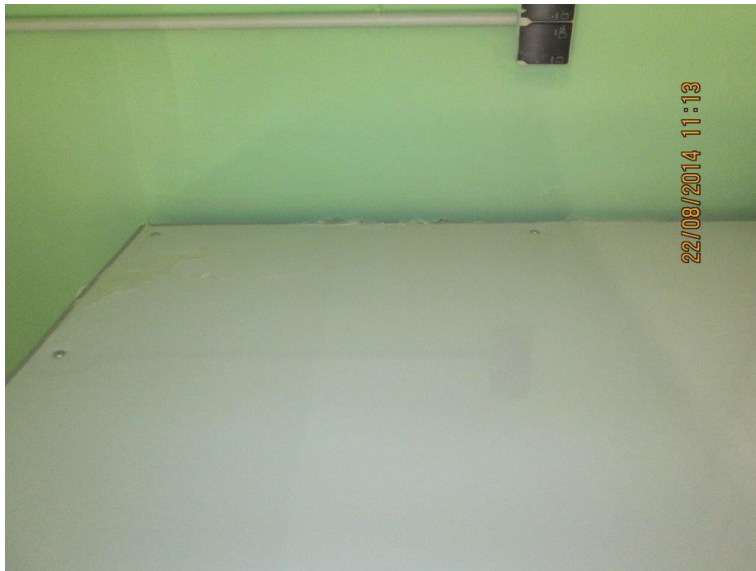
Не сняли защитную пленку с мебели