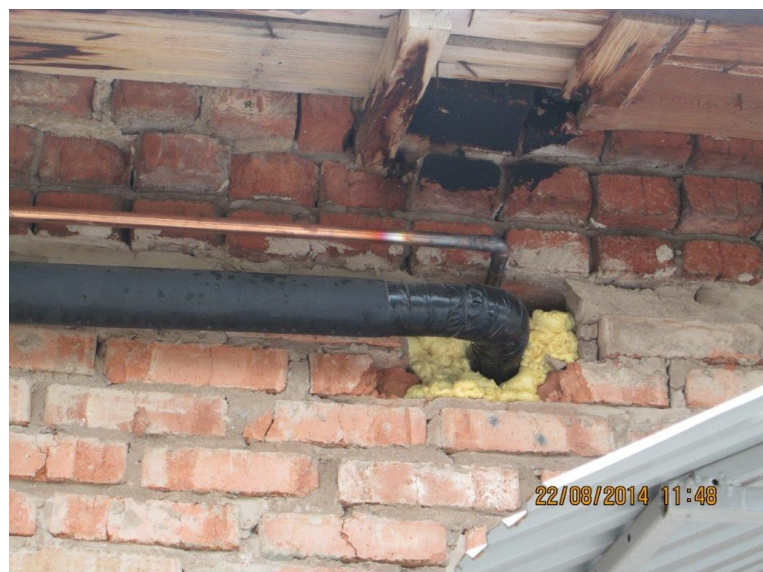
Трубопроводы проходят через стены без гильз.