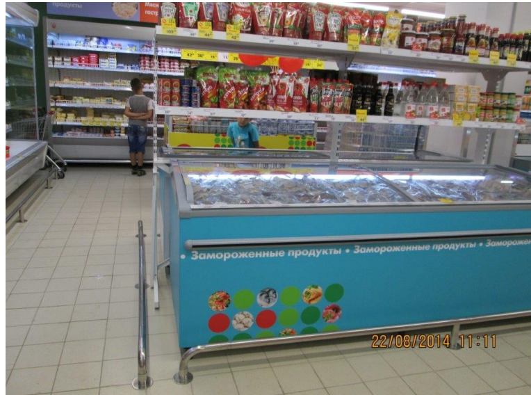
Лари не выставлены; двухуровневая суперструктура выходит за габариты ларей.