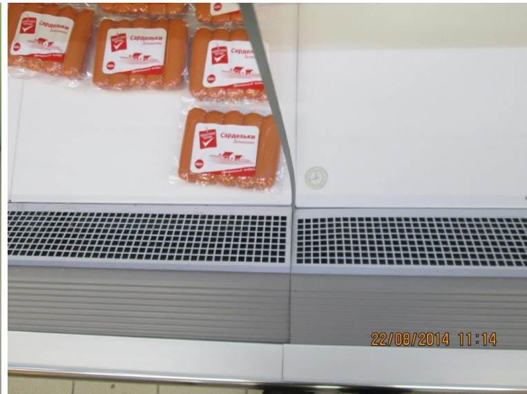
Делитель не подходит по размеру — выгнут