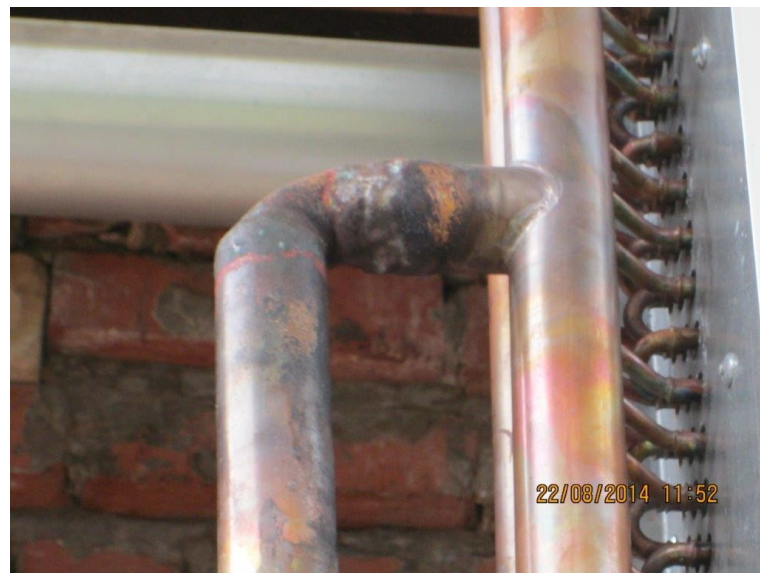
Заужен диаметр угла