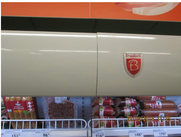
Вся мебель собрана с изъянами. Плохо состыкована.