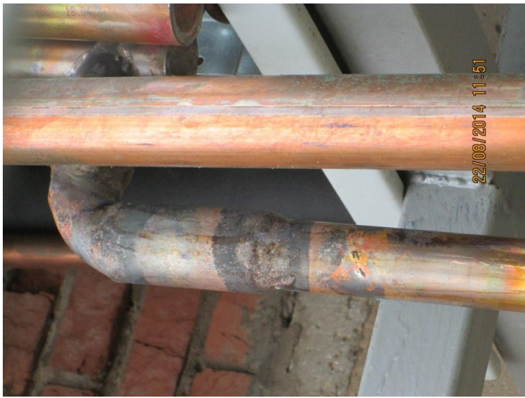
Заужен диаметр трубопровода